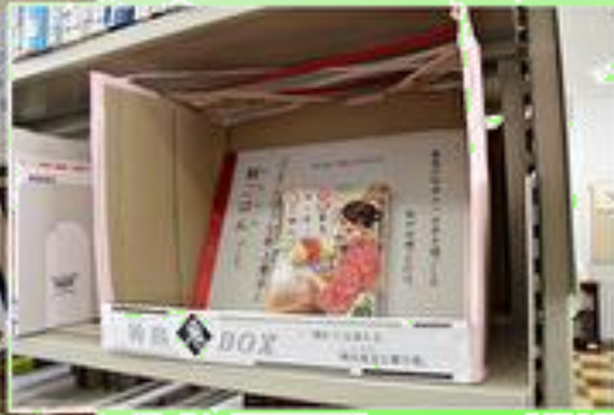
<令和2年11月> 図書室はミステリー