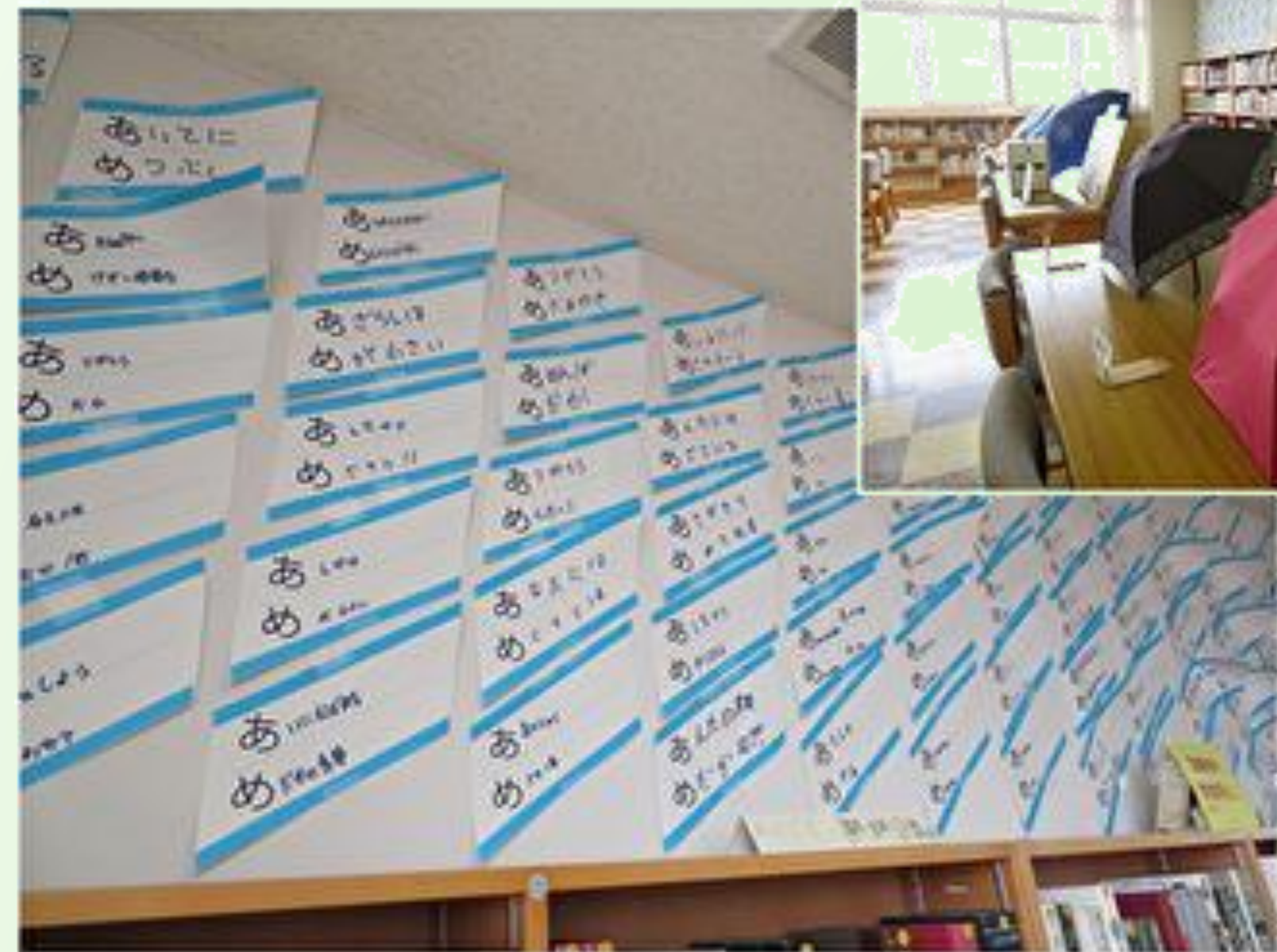
< 令和元年 6 月 > 雨博2019