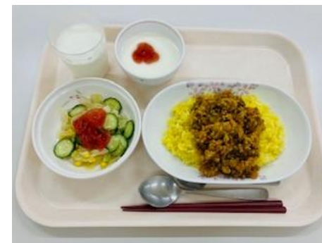
6月2日 キーマカレー