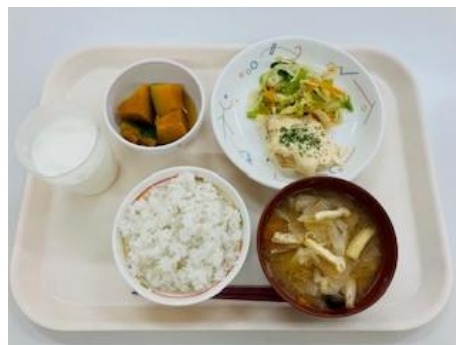
6月1日 カレイの梅マヨネーズ焼き