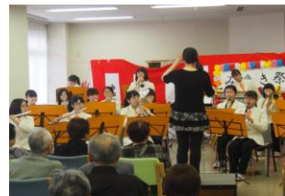
「みゆきの丘」での訪問演奏

毎朝、生徒昇降口に立ち大きな声で挨拶をしたり、職員用トイレの清掃を自主的に行ったりしている、運動部の生徒たちも含めて、明新館高校の生徒は、「他人の役に立つ」体験の中で、大切なことを学んでいると思われます。