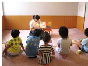
図書委員会「読みタイムかせタイ」

生徒会も、「ふれあいトークかみのやま2016」（11月16日、主催：上山地区少年補導連絡会・上山署）に参加し、「地域の中の私たち～地域のためにできること」をテーマに、中学生とともに意見を出し合うなど、地域貢献活動に積極的です。