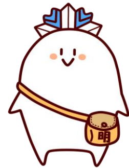
キャラクター「めいのすけ」

一目で上山明新館高校だとわかるようにその頭文字であるKMHのアルファベットを使って作成。明るい3色の色合いは普通科、食料生産科、情報経営科の3学科をイメージしました。丸形、色の明るさは本校の校風を表したものです。