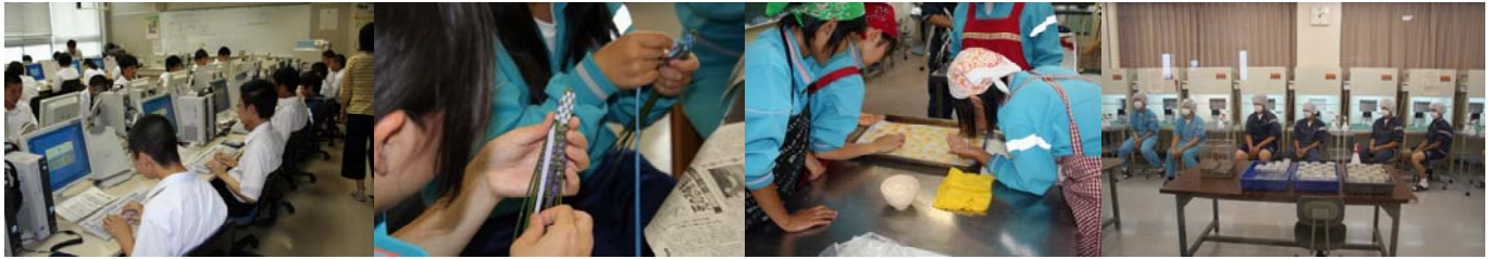
名刺を作ってみよう

これまで経験したことのない専門学科の授業に、中学生のみなさんは興味津々で意欲的に参加していました。