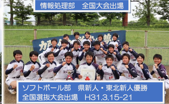
ソフトボール部 県新人・東北新人優勝 全国選抜大会出場 H31.3.15-21