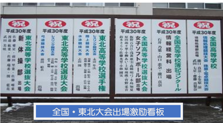
全国・東北大会出場激励看板