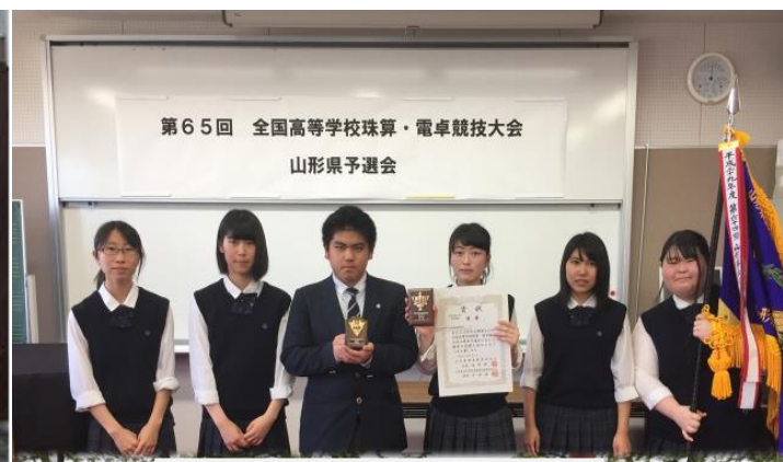
情報処理部 全国大会出場