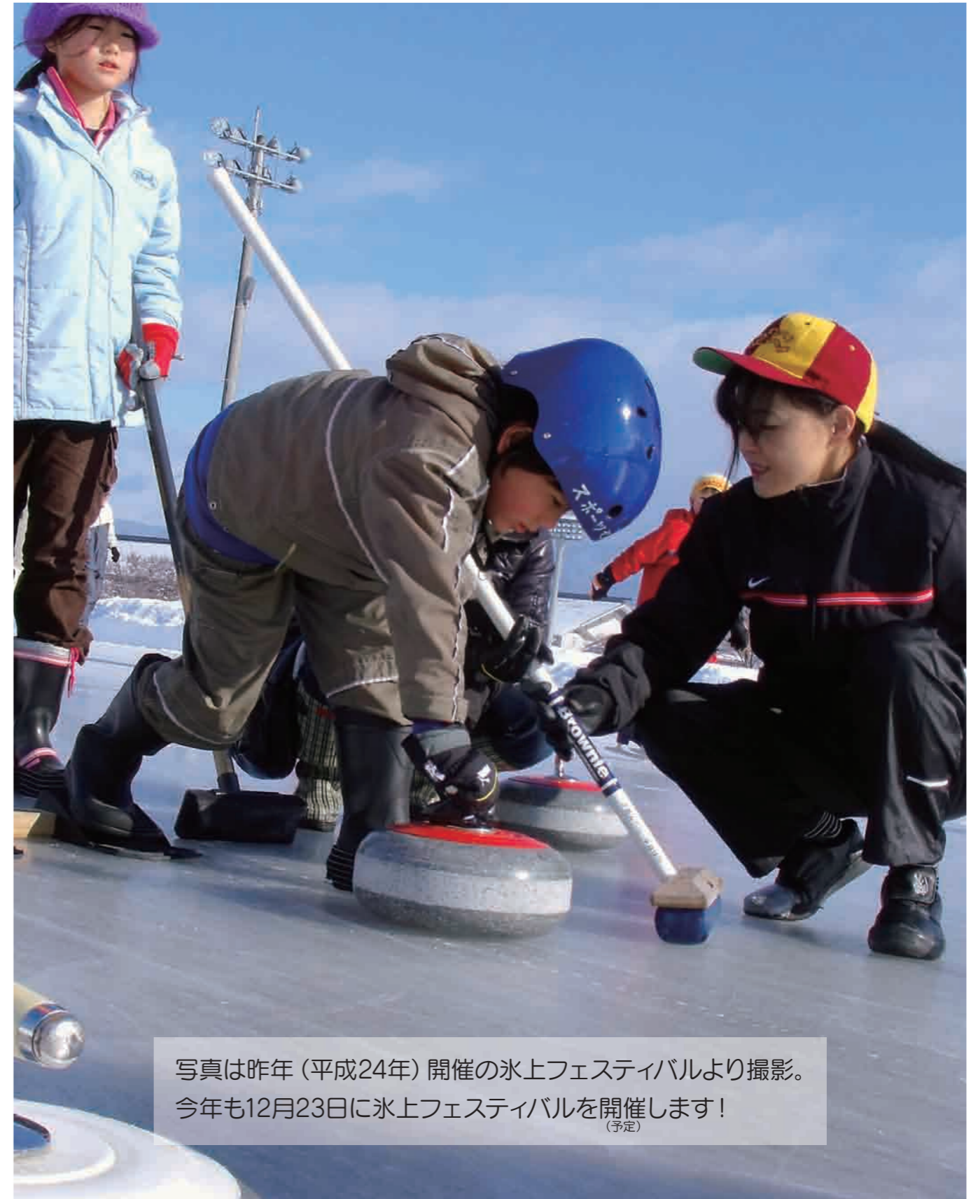
写真は昨年(平成24年)開催の氷上フェスティバルより撮影。 今年も12月23日に氷上フェスティバルを開催します! (予定)