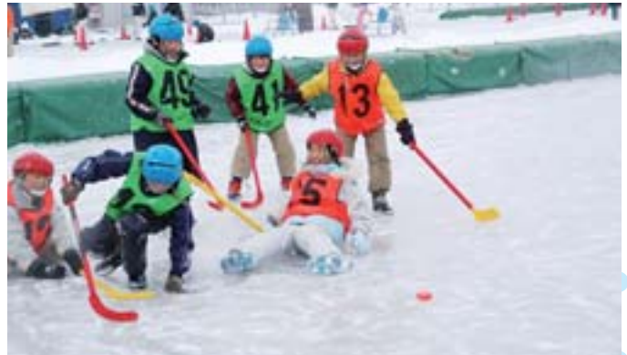
氷上フェスティバル