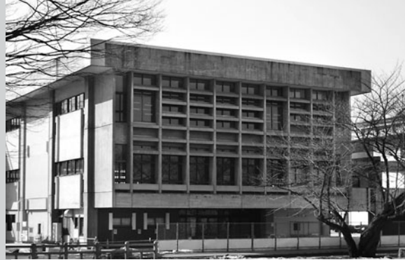
山形県武道館(合宿所)