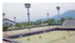
スポーツセンター テニスコート