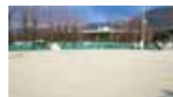
流通センター 庭球場