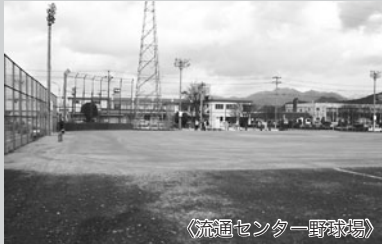
〈流通センター野球場〉