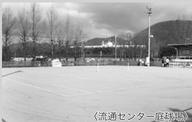
〈流通センター庭球場〉