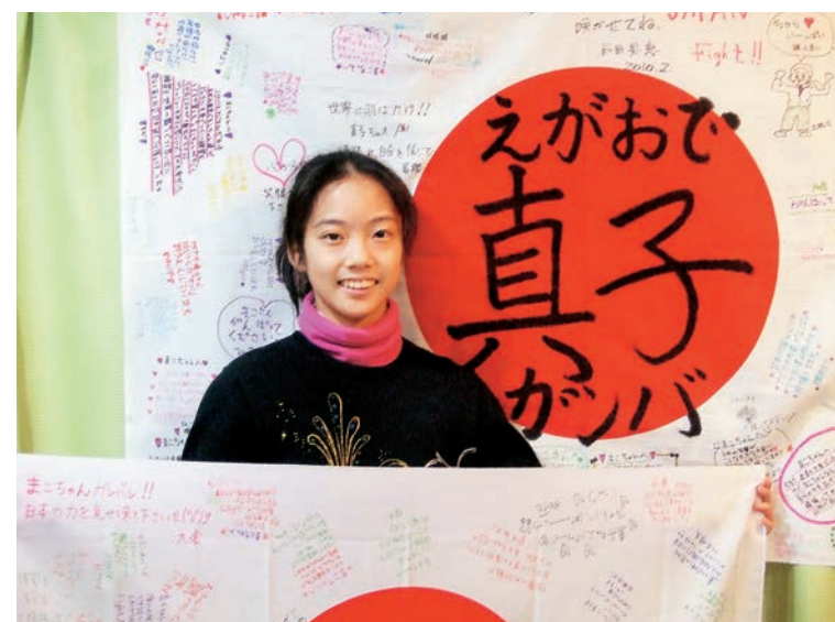
★ジュニア日本代表に選出：大会前に応援の寄書きをたくさん頂きました★