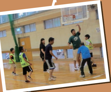
バスケットを体験してみたい。