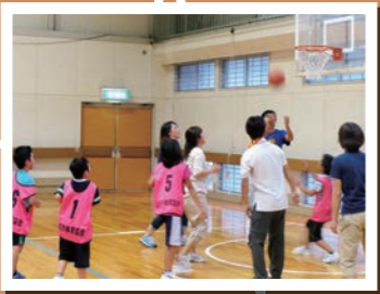
バスケットが上手になりたいから。