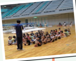
トランポリンに興味を持ってもらいたくて。