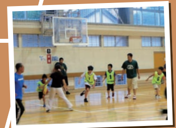
色々な体験をさせ、球技にも興味を持ってほしいから。