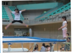
なかなかスポーツをする機会がないので、いろいろな体験をしてほしかった。