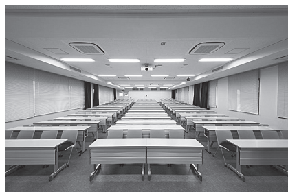
ディスクおよびチェアの納品の様子