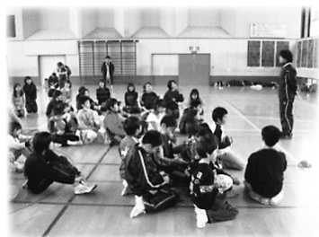
H22 2/27 滝山小学校講習会

小学校の授業やスポーツ少年団の練習等で、タグラグビー指導者派遣を行っています。高校中学ラグビー部が講師となる、『小中高連携事業』としても対応しています。ご相談ください。