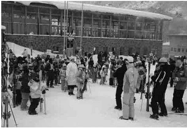
山形市民スキー教室の写真

近年は地球温暖化、スノースポーツやレジャーの多様化等スキーを取り巻く環境は年々変化しております。なかでも全国的にスキー人口が減ってきていると言われており、山形県も例外ではありません。小学校の時には学校行事のスキー教室があり、ほとんどの子供たちがスキーをしておりますが、中学、高校ではスキーを競技として取り組んでいる生徒達しかいないといつても過言ではありません。その生徒