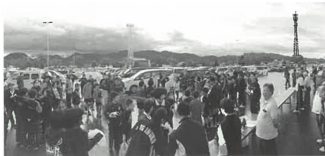
参加団数 55団・約700名の多くの方に参加いただきました