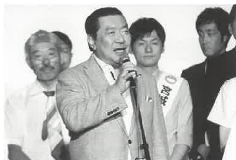
【「発掘!おもしろ東北人2018」イベントにて】