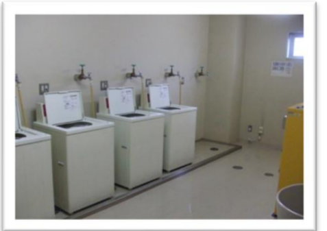
○ コインランドリー（2F）