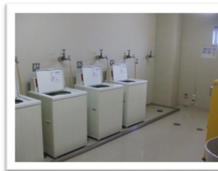
○ コインランドリー（2F）