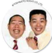
よしもと 笑い芸人 健康ウォーキング指導士 レギュラー