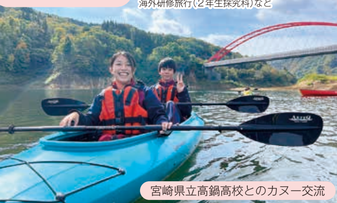
宮崎県立高鍋高校とのカヌー交流

マラソン大会／研修旅行(1年生・2年生普通科) 海外研修旅行(2年生探究科)など