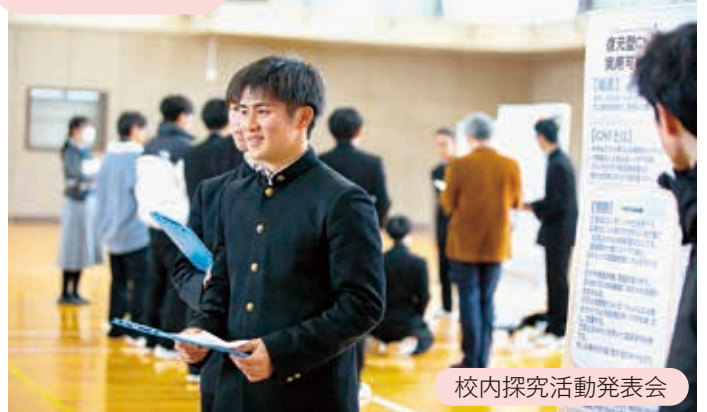
校内探究活動発表会